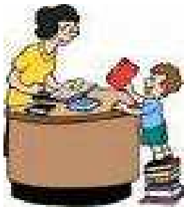
Το βιβλίο εξυψώνει τους αναγνώστες

διαλέξουν αυτό που τους αρέσει περισσότερο.